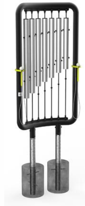
Kotwa do gruntu

'Ella' to dzwony rurowe wolnostojące, które składają się z metalowych, odpowiednio strojonych rur o różnej długości. Im dłuższa rura tym niższy dźwięk wydobywa, a sam instrument charakteryzuje się wysokimi częstotliwościami i subtelnym polem alikwot. Aby cieszyć się ich niesamowitym brzmieniem należy dołączonymi do instrumentu pałkami uderzać w ich środek. Nawet najprostszy rytm wybijany intuicyjnie stworzy interesującą melodię.